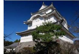
夷隅川と街並みを一望。月曜休館（大多喜城）