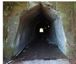
手作業で掘った跡がそのまま（永昌寺トンネル）