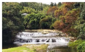
幅30m、落差4mの滝。春には川幅いっぱい鯉のぼりが！（黒原不動滝）