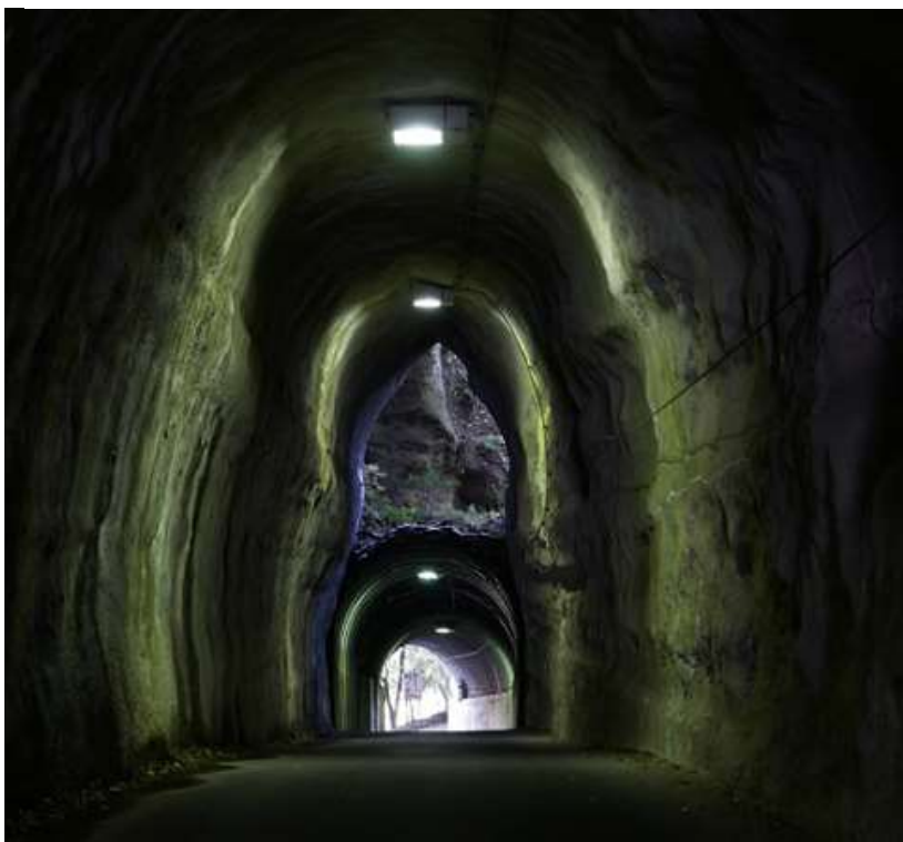
「映え」スポット！ 2階建てトンネル（共栄向山トンネル）

養老溪谷駅から、その先のスポットへ足を延ばしたい方のために、観光タクシーを御用意しております。効率的に、ワガママに、臨機応変に、あなただけの特別な旅をサポートします。