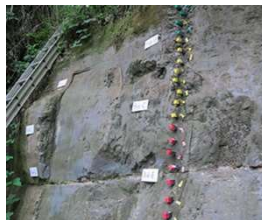
世界的発見！！地球磁場逆転地層（チバニアン）