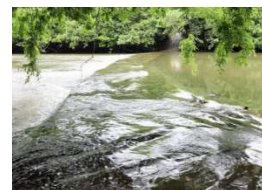
道の上を夷隅川が流れる！（大戸の洗い越し）